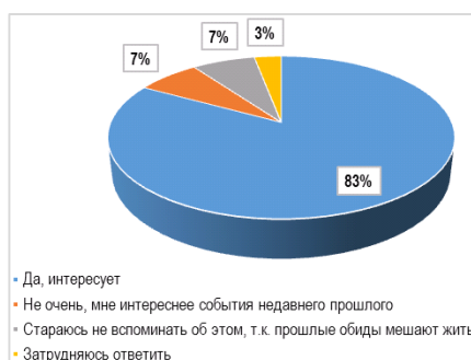
График 1 – Степень интереса молодёжи к событиям депортации 1944 г. (% от числа респондентов)

Несмотря на то, что значительной части опрошенных безынтересна этническая катастрофа 1944 г., почти для каждого шестого респондента она не привлекает особенного внимания (с разными формулировками) среди череды трагедий, произошедших в XXI в. с чеченским этносом. Думается, что для подрастающих поколений чеченцев необходимо на постоянной основе проводить мероприятия, акцентированные на историческом и социокультурном значении горестного факта истории этноса.