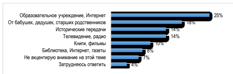
График 2 – Источники информации о депортации чеченцев (% от числа респондентов)

В ходе выполнения проекта было необходимо установить главные каналы, посредством которых сегодня информация о депортации чеченцев в 1944 г.?, – 29 % молодых людей отметили, что осведомлены о случившемся из исторических передач телевидения, радио; каждый четвертый респондент (25 %) узнал о событиях 1944 г. от образовательных учреждений и сети Интернет. От бабушек, дедушек, старших родственников информированы о трагедии 18 % опрошенных; сослались на прочитанные книги, газеты, художественные и документальные фильмы по тематике вынужденного переселения 18 % респондентов; не акцентируют внимания на проблеме высылки народа 7 % опрошенных, затруднились ответить 4 % молодых людей.