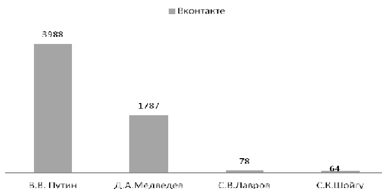
Рис. 2. Количество сообществ в социальной сети «ВКонтакте» по состоянию на 04.05.2017 г.

В рисунке 2 отображается количество сообществ по запросам, критериями которых выступали имена политиков.