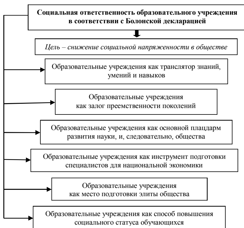
Рис. 2. Социальная ответственность образовательного учреждения в соответствии с Болонской декларацией (автор – Д.А. Лунёв)

Необходимость применения современных подходов к управлению социальной ответственностью основывается на таких предпосылках, как рост автономности образовательных организаций и необходимость информационной прозрачности для их иностранных партнёров. Продолжающийся процесс формирования общеевропейского образовательного пространства с едиными стандартами, требованиями и методологическими подходами к образовательному процессу обязывает образовательные организации ориентироваться на положения Болонской декларации, одним из основных пунктов которой выступает социальная ответственность (рис. 2).