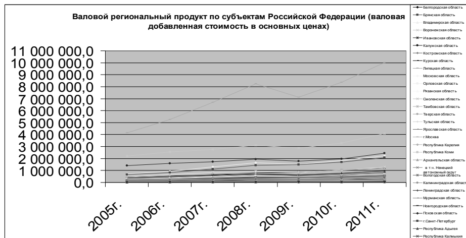
Рис.2. Валовой региональный продукт по субъектам Российской Федерации