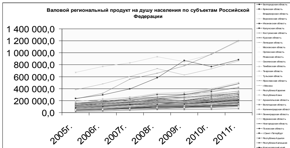
Рис. 1. Валовой региональный продукт на душу населения по субъектам Российской Федерации