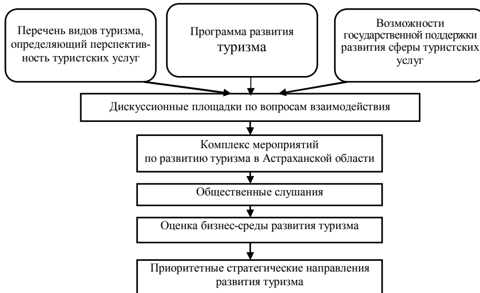
Рис. 1. Модель взаимодействия ГЧП в сфере туристских услуг Астраханской области

Реализация стратегических направлений развития туризма возможна лишь при тесном взаимодействии государства и бизнеса в рамках ГЧП, которое необходимо и возможно осуществлять по следующим основным направлениям: инвестиции, инновации, качество туристского продукта, а также маркетинг (см. рисунок 2).