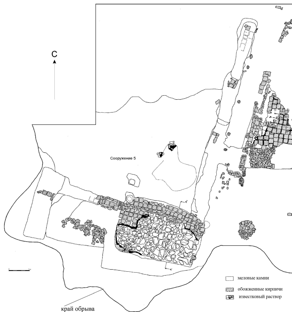
Рис. 1. План сооружения 5 на Красном бугре Селитренного городища

В 1995–1997 гг. и 1999–2000 гг. на Селитренном городище проводил раскопки Селитренский отряд кафедры археологии МГУ им. М.В. Ломоносова. Исследования велись на Красном бугре, который является одной из самых высоких точек городища. Южный и юго-западный края его круто обрываются к старому, ныне пересохшему, руслу Ахтубы, образуя обрыв высотой около 15 м. Основным объектом, исследованным на раскопе, был большой усадебный дом, состоящий из 16 помещений [2, с. 43–90]. В 1999 г. раскопками была охвачена западная часть дома и участок, примыкающий к нему. Здесь были обнаружены остатки сооружения 5, большая часть которого разрушена при обвале южного края Красного бугра. В раскопе была исследована северная (очень небольшая) его часть. Это обстоятельство сильно затрудняет интерпретацию назначения этого объекта. Тем не менее, материал, полученный при раскопках сооружения 5 настолько ярок и интересен, что требует самостоятельной публикации.