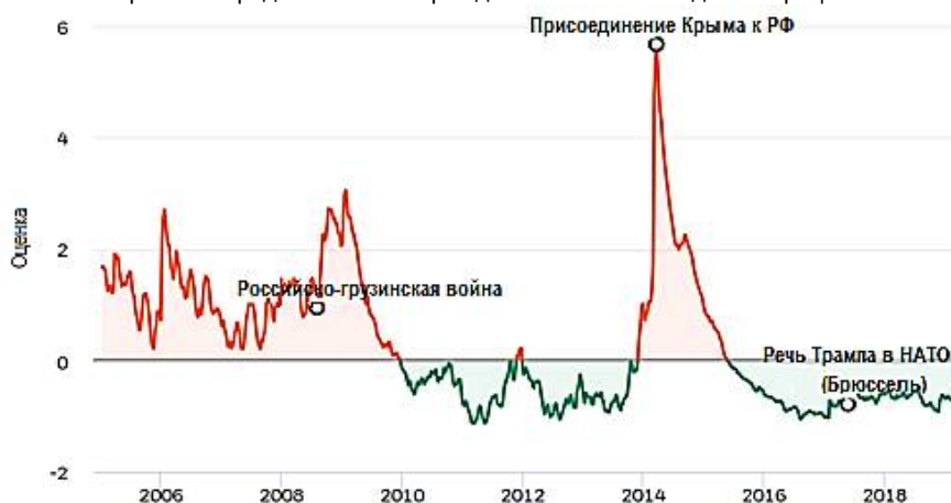
Рис. 1. Конфликт Россия – НАТО (Black Rock Investment Institute, индекс BGRI)

Спустя год после крымских событий мировой рынок постепенно стабилизировался и, несмотря на речь Д. Трампа в штаб-квартире НАТО в Брюсселе 25 мая 2017 г., в которой президент США критически высказался о том, что «Соединённые Штаты несут несправедливое бремя» [4] в виде расходов на альянс, ситуация оставалась стабильной. Означает ли это, что на фоне более значимых проявлений геополитической конфронтации (в т. ч. на Ближнем Востоке) Чёрное море и Кавказ перестали представлять интерес для политической администрации США?