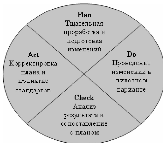
Рис. 2. Цикл Деминга

Согласно схеме на рисунке 2, изменения в организации должны проходить циклически, включая следующие четыре операции: