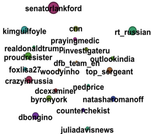
Рис. 2. Лидеры мнений и сенсоры дискуссионного ядра #Russia

сообществах являются различные дискурсы, способные объединить пользователей с разными социально-политическими статусами для реализации их собственных потребностей и задач.